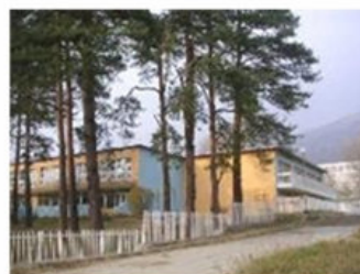
Детска градина “Първи юни” преди и след реконструкцията