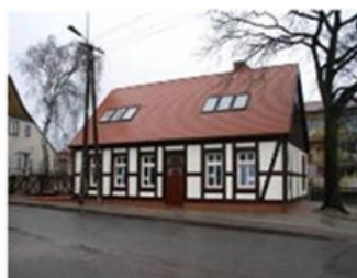
ул „Кошинеров” 13 преди и след реконструкцията

Сградите претърпяват пълна реконструкция с последни технологии (изолация с полистирен на пяна), но автентичният им вид е запазен, като се показва дървената конструкция.