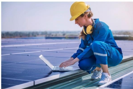
The shift towards clean, secure energy hinges on the participation of women.

Като част от проекта W4RES, 4 жилищни квартала в Берлин се проучват от енергийна гледна точка.