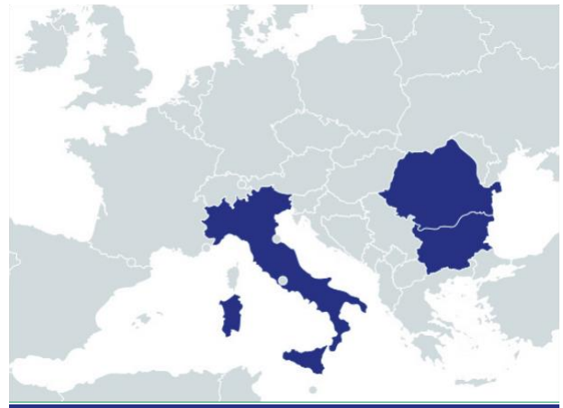
Проектни области- PadovaFITExpanded.

Продължителност Юни 2019 до Ноември 2022