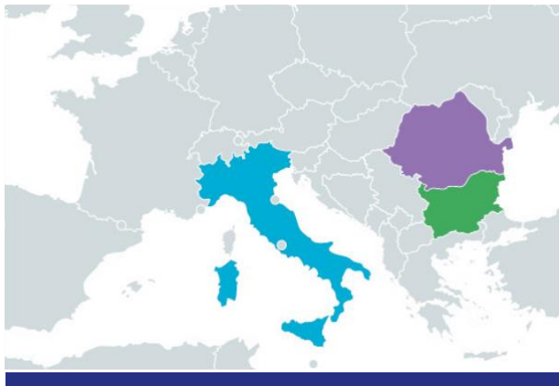
Държави, участващи в проекта

В рамките на проекта през втората половина на 2021г в община Падова ще бъде създаден финансово - икономически модел и внедрена услугата „Едно гише“ за енергийното обновяване на жилищни сгради. Бизнес моделът на Падова ще бъде адаптиран от към местните нужди и условия на община Тимишоара в Румъния и ще заработи през 2022г. Енергийна Агенция – Пловдив ще окаже техническа помощ на общините Видин и Смолян в България за подготовката и изпълнението на План за действие за внедряване на услугата. Разработената методология ще позволи на българските общини да внедрят услугата във възможно най- кратки срокове при стартиране на програми за енергийно обновяване.